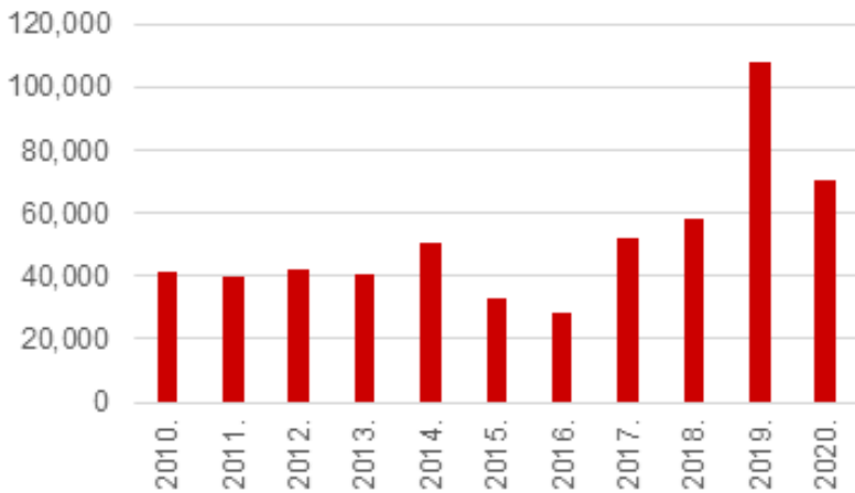
Broj ugovora o osiguranju otplate kredita u Republici Hrvatskoj